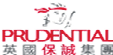
Gambar 3.9 Logo Prudential Corporation Asia

Prudential memiliki operasi asuransi jiwa di 12 negara Asia, yaitu di Cina, Filipina, Hong Kong, India, Indonesia, Jepang, Korea, Malaysia, Singapura, Taiwan, Thailand dan Vietnam. Prudential juga memiliki operasi pengelolaan dana di 10 negara Asia yaitu Cina, Hong Kong, India, Jepang, Korea, Malaysia, Singapura Taiwan, Uni Emirat Arab, dan Vietnam, dengan dana kelolaan sebesar £52 miliar ( data 31 Desember 2010 )