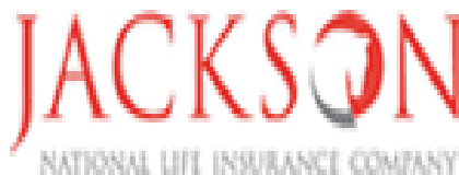
Gambar 3.8 Logo JNL

Melalui perusahaan afiliasinya, JNL juga menyediakan pengelolaan aset dan jasa perdagangan sekuritas ritel. Nasabah: Lebih dari 2.8 juta polis dan kontrak in force . Tenaga Pemasaran: 130.000