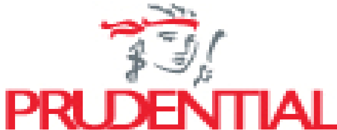
Gambar 3.5 Logo Prudential

PRUDENTIAL Always Listening. Always Understanding, yang berarti adalah Selalu Mendengarkan. selalu Memahami.