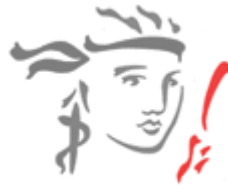
Gambar 3.4 Logo Prudential

Menggambarkan kemampuan seseorang untuk melihat dirinya apa adanya