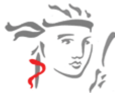
Gambar 3.3 Logo Prudential