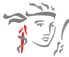
Gambar 3.2 Logo Prudential

Melambangkan kemampuan seorang pemanah yang jitu dan penuh perhitungan