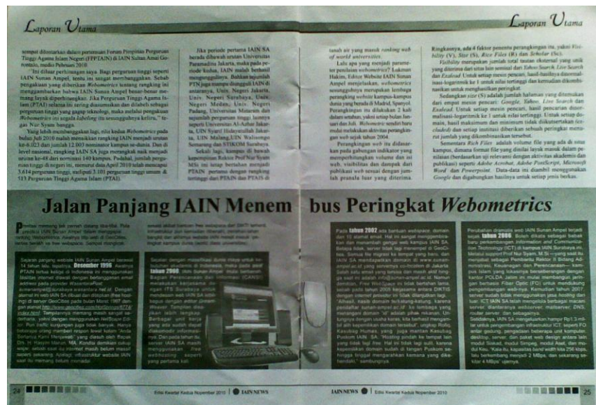
Gambar 3.1 IAIN News Media Komunikasi dan Informasi IAIN Sunan Ampel Surabaya