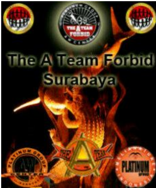
Logo The A Team Forbid Surabaya: