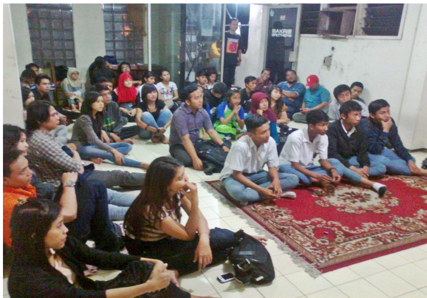
Anggotakomunitas The A Team Forbid Surabaya mengikuti kegiatan home sharing Foto para Leader The A Team Forbid Surabaya: