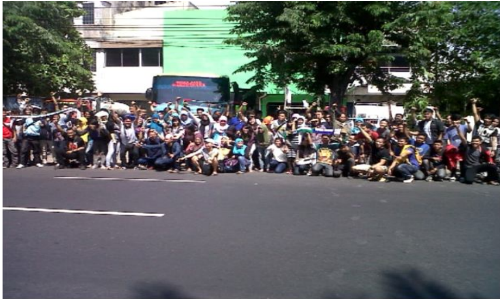
Foto Anggota komunitas The A Team Forbid Surabaya di depan Jl. Indrapura No. 36 Surabaya