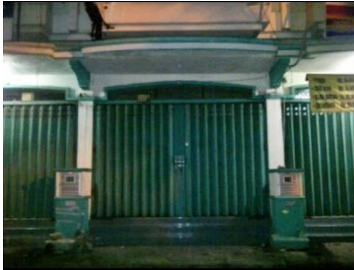
Jl. Dukuh Kupang Timur Gang X Nomor 69 A