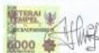
Khumairoh Halimatuz Sya'dia C51212127