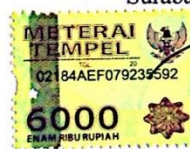
Moch Reza Nidzom Fahmi B04212012