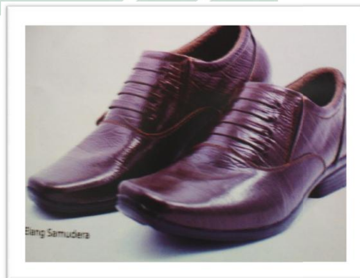
Gambar 04.05 Berkreasidenganmembuatsepatu

Sentra Ukm Merr Surabaya memiliki bermacam-macam tas. Diantaranya Tas Kulit, Tas Kain, bahkan tas dari bahan daur ulang juga ada. Semuanya dikemas secara apik dan dapat menambah koleksi konsumen yang hobby mengoleksi tas.