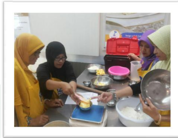
Gambar 04.10 Pelatihan bersama Bogasari

Rapatperbulan yang diadakanolehDisperindag Kota Surabaya dalammelakukanrefleksidalamkurunwaktusatubulandenganmembahas masalahhinggasolusinya. AdapunkegiatanUkm yang seringyaknimemasarkanprodukmelalui bazar.