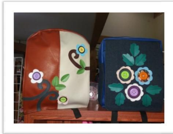
Gambar 04.04 Berkreasidenganmembuattas

Sentra Ukm Merr Surabaya memiliki bermacam-macam tas. Diantaranya Tas Kulit, Tas Kain, bahkan tas dari bahan daur ulang juga ada. Semuanya dikemas secara apik dan dapat menambah koleksi konsumen yang hobby mengoleksi tas.