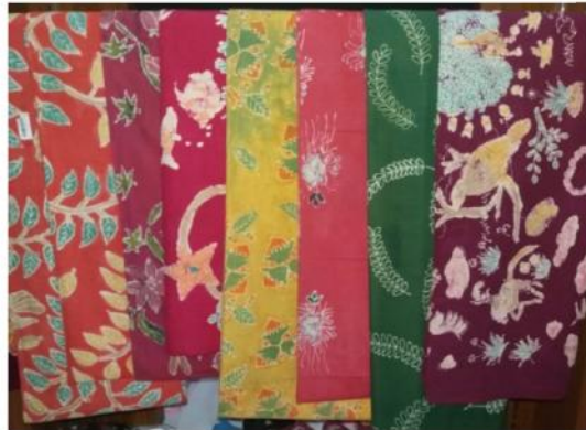
Gambar 04.03 Berkreasidengan membuat batik

Salah satunya Ukm dengan produk Fashion, atau busana cukup banyak di Surabaya. Mulai dari Batik Kharisma , dimana batik ini mulai dari batik ikat jumput dengan teknik ikat-celup, sampai dengan batik mangrove yang dibuat dengan pewarna alami dari buah mangrove dan semua menyajikan keindahan pada batik tersendiri.