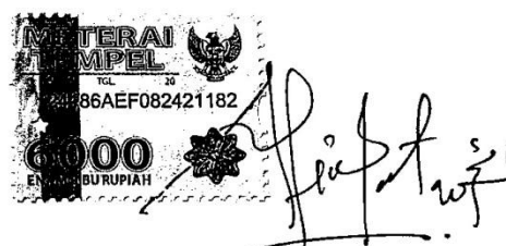
Aimmatu Nur Azizah