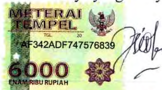
Fika Fitrotin Karomah