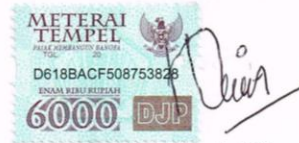
Siti Nurcholifa NIM: D03210014