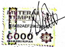
Ahmad Sodik D04212002

Surabaya, 02 Februari 2017 yang membuat pernyataan,