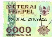
S MITA W

Surabaya, 23 Januari 2017 Yang Menyatakan,