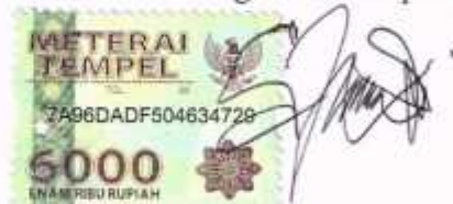
Shally Vallagia Unando D91213165