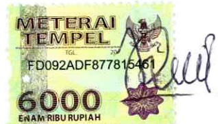
Riska Nurhayati C02213065