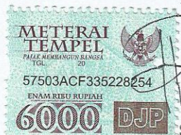
Septi Putri Hidayati D74210044