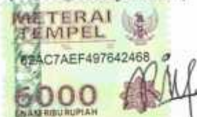
Reti Dwi Anggraini