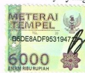
Tri Djoyo Budiono