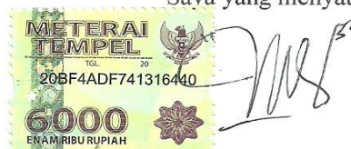
Fadhilah B Rahmatika