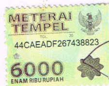
Nurul Burhan E03213073