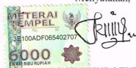
BINTI KHURUTUT A'YUNIN