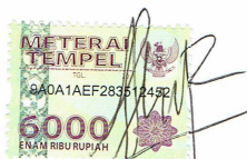
Umar Faruk NIM: E03213088