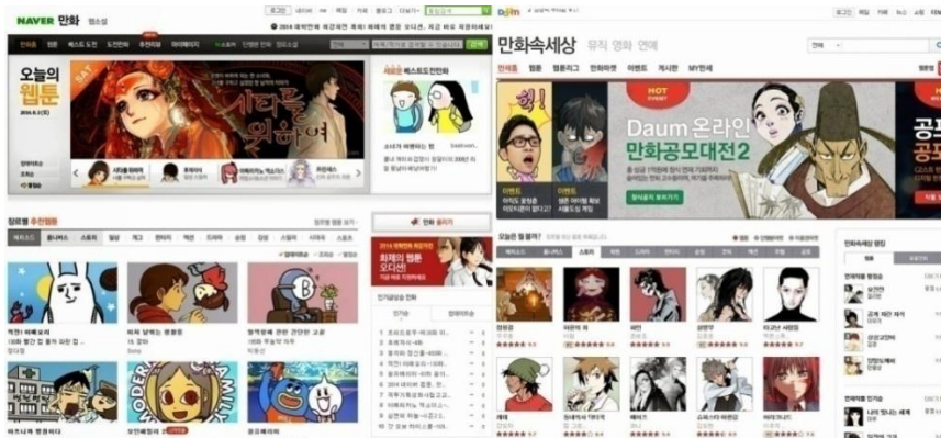
Gambar 2.2 Homepage NAVER Webtoon Korea