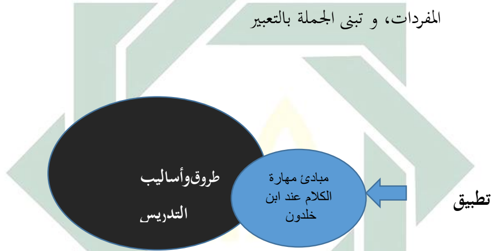
صورة ١. ب (مساودة التعليم الكلام)

وبإضافة إلى ذلك أن طريقة التدريس وأساليب مستخدم توفق بمهارة الكلام التي يوجه التركيز في الطلاب فبذلك تجذب تنبه الدسائس ويحضر نشاطهم في التعليم والتعلم، وهذه شاكلة التدريس تسهل وتساعد في عملية طلاقة كلامهم، وكفاءة لغويتهم، من نظرية اللغوية النحوية والصرفية الى إستعمال و تجربة ما تعلمونهم من المفردات، و تبني الجملة بالتعبير