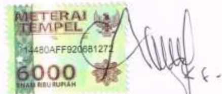
Aprilia Fatimah Subiyakto NIM.C92215086