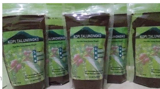
Hasil Kemasan Disertai Label