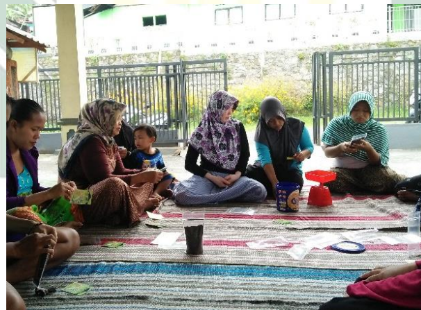
Proses Penempelan Label pada Kemasan