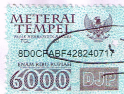
Nur Aini NIM. B07210080