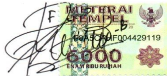
Fatimatus Zahroh B NIM. G71215017

Surabaya, 17 September 2019 Saya yang menyatakan,