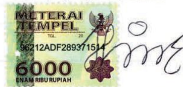
Anggi Nur Armawan B02210008

Surabaya, 28 juli 2015 Saya yang menyatakan,