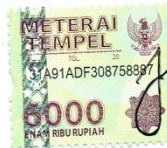
Asmaul Husna NIM: B73211075