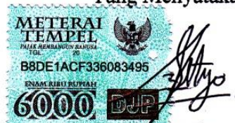
Setyoning Asiyatu Tiva B54210063