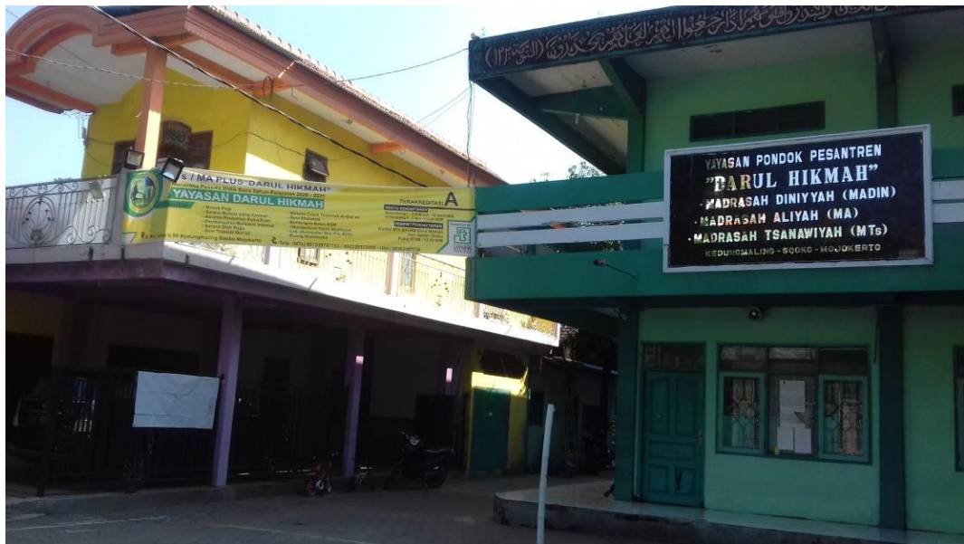
Gambar 4.1 MA Darul Hikmah Mojokerto