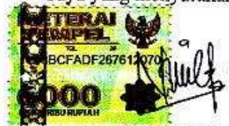
Nurul Fitriani C04210029

Surabaya, 03 Agustus 2015 Saya yang menyatakan,