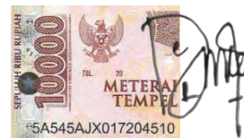
Daffa Eksa Rizky D03217008