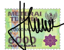
Mustami'ir Rosyidah NIM.C94217053

Surabaya, 16 Oktober 2020 Saya yang menyatakan,