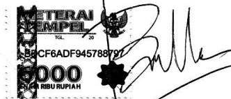
Bella Ayu Chikita NIM. C03211036