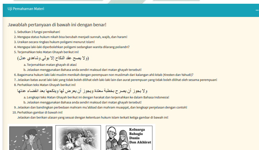
Gambar 4.11 Tampilan uji pemahaman materi

Pada menu uji pemahaman materi, peserta didik akan mendapat soal uraian terkait materi yang mereka pelajari. Hal tersebut bertujuan untuk mengukur sejauh mana pemahaman mereka terhadap materi bahan ajar. Pada menu uji pemahaman terdapat fitur submit yang berfungsi sebagai tempat mengirimkan jawaban peserta didik.