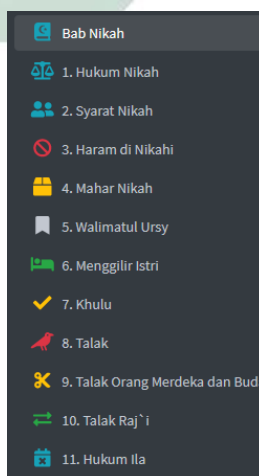
Gambar 4.9 Menu materi nikah

Pada menu bab nikah, peserta didik dapat memilih materi mana saja yang ingin mereka ketahui tentang bab nikah, mulai dari materi hukum nikah sampai dengan materi hadlanah.