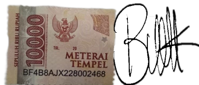
Moch Chisnur Rofiq A02214010