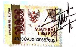
Yasinta Nur Aulia