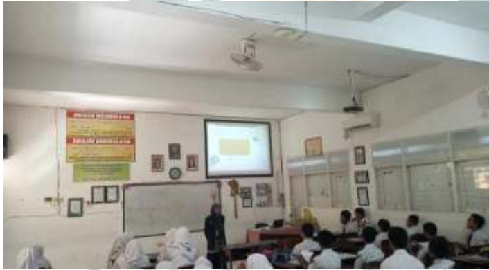
الصورة ٣ . ٤

في الاختتام تسئل الباحثة الى الطلاب "هل عندكم السؤال" بعد ذلك تلخص الباحثة والطلاب التعليم ثم تتذكر الباحثة الى الطلاب ليتعلمون في المنزل خاصة تعلم اللغة العربية ثم تختتم التعليم بقراءة " الحمد لله رب العلمين" و تقرأ الباحثة السلام عليكم ورحمة الله وبركاته.