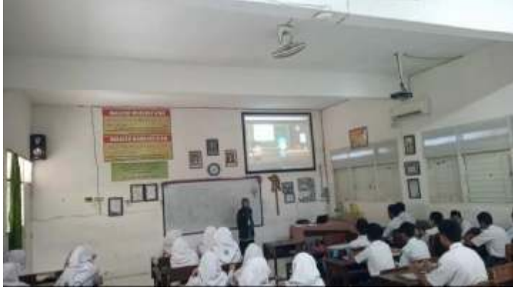
الصورة ٢ . ٤

في الاختتام تسئل الباحثة الى الطلاب "هل عندكم السؤال" بعد ذلك تلخص الباحثة والطلاب التعليم ثم تتذكر الباحثة الى الطلاب ليتعلمون في المنزل خاصة تعلم اللغة العربية ثم تختتم التعليم بقراءة " الحمد لله رب العلمين" و تقرأ الباحثة السلام عليكم ورحمة الله وبركاته.