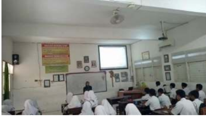
الصورة ٤ . ١

استخدمت الباحثة نموذج التعليم بالاكتشاف مع نهج التعليم العلمي وطريقة التعليم الانتقائية حيث كانت هناك خمس خطوات للتعليم. أولاً، عرضت الباحثة الفيديو المتحركة التي قد صنعت عبر فلوغ نو (Vlog Now) عن المادة "الهوية" على شاشة العرض. استمع الطلاب على الفيديو. بعد انتهاء الفيديو، سألت الباحثة الى الطلاب عن المفردات التي لم يعرفوها وما لم يفهموا عن المادة في الفيديو المتحركة.