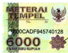
Rudy Wahyu Prasetyo