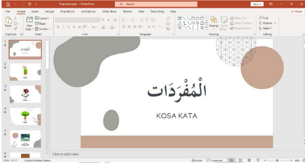
صورة ٤.٤ مادة المفردات "البيت" في Power Point

الاختتام هو الباحثة مع الطلاب اختتموا نتائج التعلم، ثم ختمت الباحثة الدراسة بقراءة الدعاء، ثم ألقى السلام.