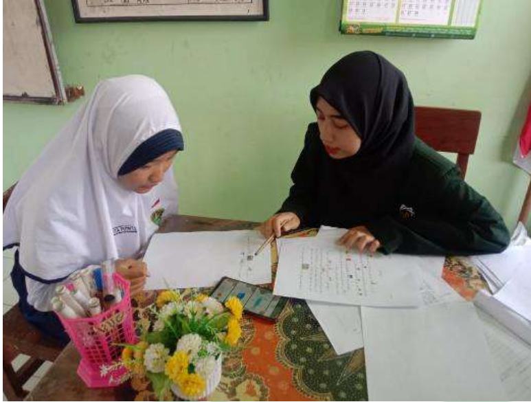
صورة ٢.٤ عملية التعليمية بوسيلة Rebus Story