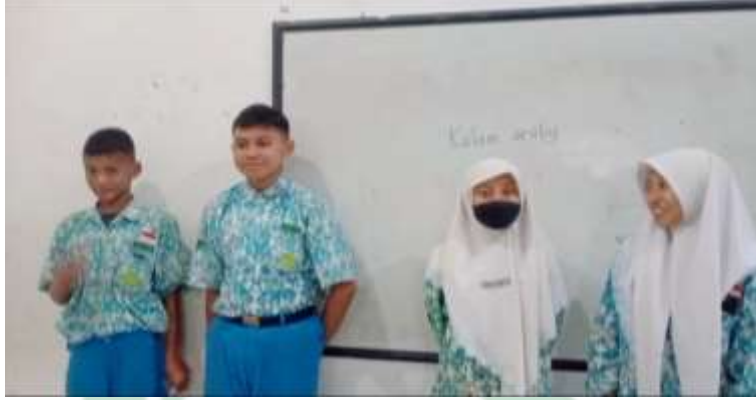
الصورة ٤ ، ٣ الصورة اختبار البعدي

المريض. ويجمع الطلاب المعلومات الكثيرة حول معنى المحادثة عن العيادة المريض.