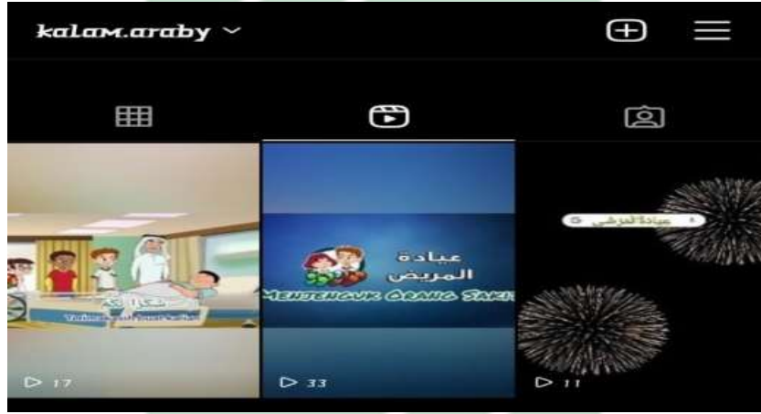
الصورة ٤ ، ٢ الصورة فيديو التعليمي عبر fitur reels instagram

المقدمة: بدأت الباحثة التعليم بالسلام "السلام عليكم ورحمة الله و بركاته" و قالت الباحثة "صباح الخير" و يجيب الطالب "صباح النور" و سئلت الباحثة حالهم بقول "كيف حالكم جميعا؟" و بعد ذلك قرأت كشف الحضور لتأكيد حضور الطالب. ثم قراءة الدعاء قبل أن يبدأ التعليم بقراءة بسم الله. ثم ارتبطت الباحثة ما يعرف الطالب بالمواد التي يدرسها. ثم شرحت الباحثة عن الأهداف و مواد التعليم.