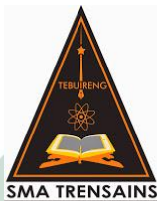
Gambar 3.1 Logo SMA Trensains Tebuireng

Secara singkat profil SMA TRENSAINS Pesantren Tebuireng 2 jombang sebagai berikut: