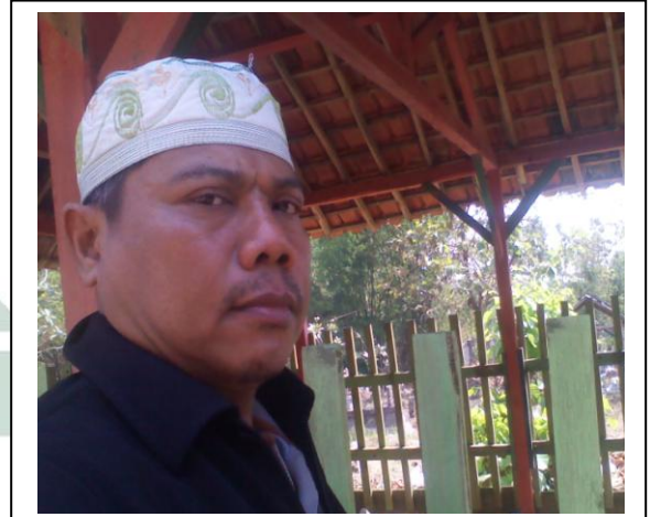
Peneliti berada dimakam mbah Samin Engkrek Dsn Sale desa Klopoduwur Blora