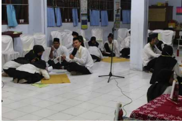
Gambar 4.5 Kegiatan LAKMUD

dan ideologi islam Ahlussunnah wal jamaah yang dibawa oleh Nahdlatul Ulama.