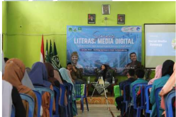
Gambar 4.9 Kegiatan literasi media

adanya pelatihan tersebut diharapkan IPNU IPPNU di semua tingkatan mulai ranting sampai anak cabang bisa mempunyai dan mampu mengelola media sosialnya masing-masing. Dan pada akhirnya mampu memaksimalkan fungsi dari adanya sosial media untuk penyampaian hal-hal terkait IPNU IPPNU juga hal positif lainnya yang ada di organisasi IPNU IPPNU.