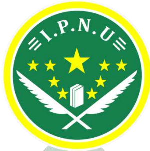
Gambar 4.1 Logo IPNU