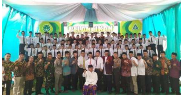
Gambar 4.3 Pengurus PC IPNU Kabupaten Blitar Periode 2019-2021