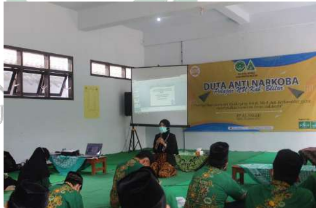
Gambar 4.8 Kegiatan Pelatihan Duta Anti Narkoba

“...Kegiatan sosialisasi bahaya narkoba ini termasuk program baru, kegiatannya di inisiasi oleh pengurus Lembaga Anti Narkoba dengan mengadakan pelatihan Duta Anti Narkoba di lingkungan PC IPNU IPPNU Kabupaten Blitar yang tugasnya nanti ya sosialisasi bahaya penyalahgunaan narkoba itu di kecamatan atau desanya masing-masing” 85