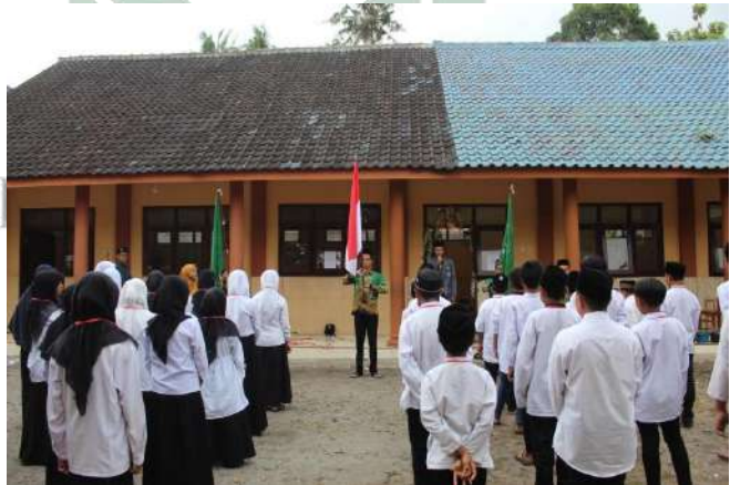
Gambar 4.6 Kegiatan Pengkaderan MAKESTA

Kegiatan pengkaderan seperti Makesta dan Lakmud dilaksanakan dalam kurun waktu yang telah ditentukan sesuai kesepakatan aturan. Kegiatan selalu diawali dengan opening ceremony dengan bentuk kegiatan yakni menyanyikan lagu Indonesia Raya, Mars IPNU IPPNU, lantunan bacaan Al-Quran, sambutan yang diakhiri dengan doa. Setelah kegiatan pembukaan selesai peserta akan menerima materi wajib yang telah tersusun kurikulum serta silabus materinya disisi lain juga terdapat kegiatan tambahan lain sesuai dengan ketentuan yang telah diberlakukan.