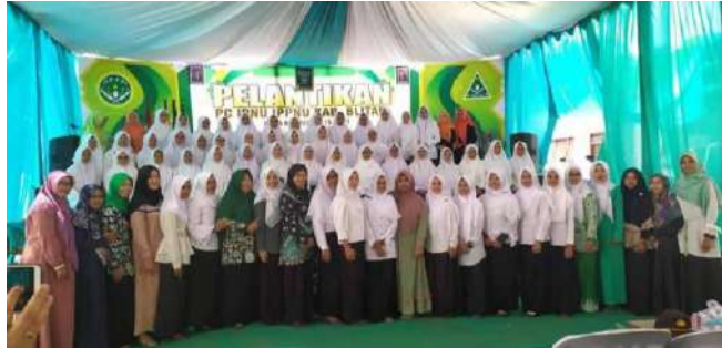
Gambar 4.4 Pengurus PC IPPNU Kabupaten Blitar Periode 2019-2021