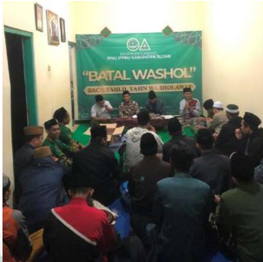
Gambar 4.7 Kegiatan rutin pembacaan tahlil dan istighosah