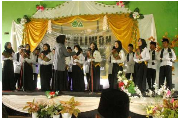
Gambar 4.10 mars saat pengajian rutin IPNU IPPNU

ayat suci al-quran, setelahnya ada penampilan mars dari penyelenggara, dan acara inti adalah pengajian dengan mendatangkan mubaligh serta ditutup dengan doa. Dalam kegiatan pengajian rutin yang diselenggarakan biasanya juga ditampilkan beberapa kesenian seperti sholawat, tari-tarian, menyanyi dan penampilan lainnya.