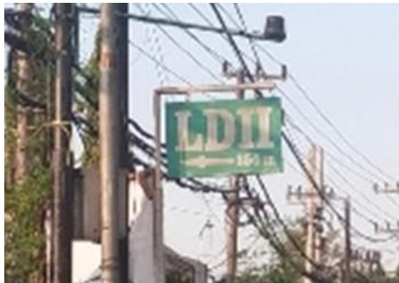
Gambar 3. Representasi dari Objek LDII yang Eksklusifitas dan Diferensitas

Hal yang umum dan ditemukan mengenai konsep LDII adalah memiliki suatu plang atau papan nama khusus seperti LDII 100 Meter yang diyakini memiliki makna. Plang atau papan nama biasanya dimanfaatkan untuk memberikan suatu petunjuk mengenai suatu lokasi atau tempat. Plang merupakan suatu tanda yang hadir dengan tiang sebagai penyangga untuk menunjukkan suatu lokasi tertentu, sehingga dapat memberikan kemudahan pada khalayak umum (Nurhadi et al, 2020; Haryadi et al, 2022). Tendensi LDII dengan menciptakan perbedaan melalui tanda-tanda yang hanya diketahui umatnya bukan suatu masalah karena sejalan dengan Peirce bahwa manusia berpikir melalui tanda (Sartini, 2007). Sehingga mencegah tanda hadir sama seperti mencegah mereka untuk berpikir. Namun, LDII adalah organisasi masyarakat Islam yang artinya aktivitas keagamaan yang dilakukan berdampingan dengan sosial. Plang mengenai lokasi yang ditempatkan pada gang-gang akan menghadirkan suatu pertanyaan mendasar terhadap LDII yakni apakah sudah hadirnya tanda tersebut.