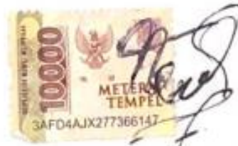
Nadhifa Salsabilla Syafa' C91219136