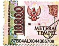
Setyo Budi Wicaksono