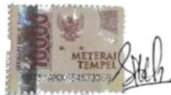
Lu'luk Ul Wafiroh D92217027