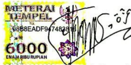
Nur Izzati Chumairoh