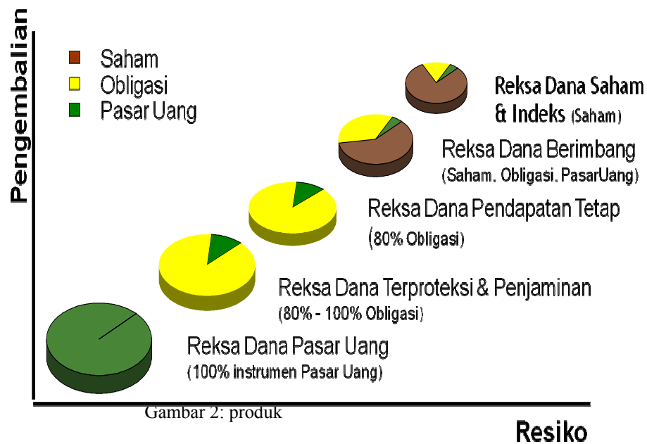
Gambar 2: produk